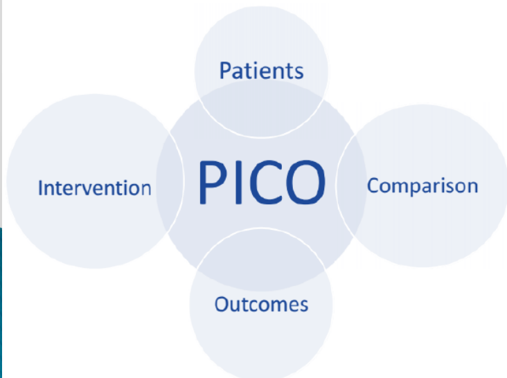
مدل PICO برای طراحی سوال

چه سوالی طراحی کنید؟ چه مدارکی پاسخگوی سوال هستند؟