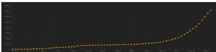
نمودار شماره ۱: روند رخداد بیماری در سطح جهان براساس گزارش دانشگاه جان هاپکینز تا ۲۹ ژانویه ۲۰۲۰